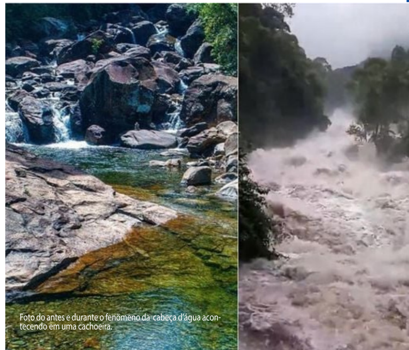
Foto do antes e durante o fenômeno da cabeça d'água acontecendo em uma cachoeira.

Em relação aos cuidados que devemos tomar para evitar ser vítimas desses fenômenos, é fundamental manter-se informado sobre as condições meteorológicas locais antes de se aventurar em ambientes aquáticos. Consultar previsões do tempo e alertas meteorológicos pode ajudar a evitar surpresas desagradáveis. Além disso, é importante estar atento aos sinais de alerta, como mudanças repentinas no clima, aumento rápido do nível da água, sons incomuns ou turbulência na água. Evitar nadar ou praticar atividades aquáticas em áreas propensas a trombas d'água ou cabeças d'água, especialmente durante períodos de chuvas intensas, é outra medida crucial de segurança. Em caso de