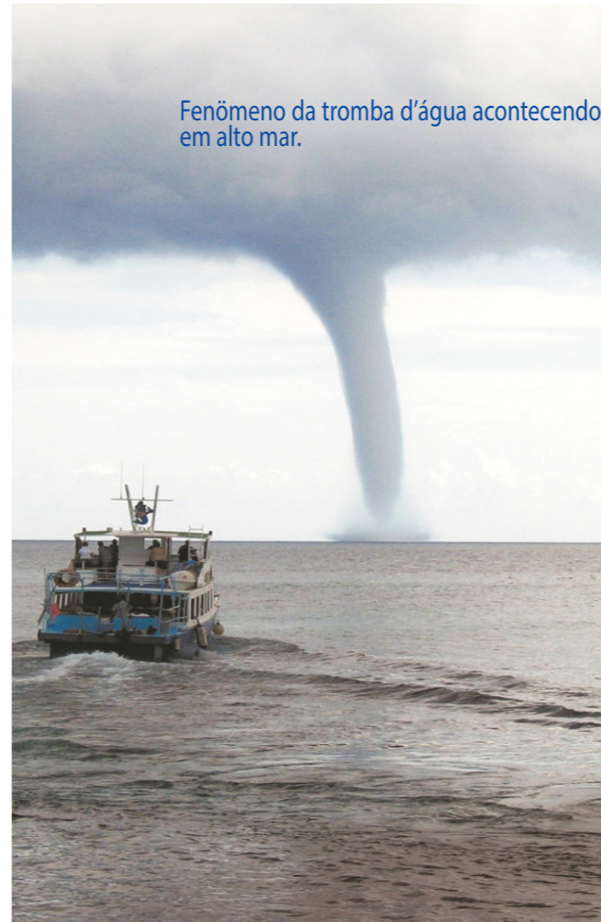
Fenômeno da tromba d'água acontecendo em alto mar.

Por outro lado, as cabeças d'água são fenômenos que ocorrem em áreas montanhosas e cachoeiras, sendo desencadeadas por chuvas intensas e rápidas na cabeceira de um rio ou em suas proximidades. A principal característica das cabeças d'água é o aumento abrupto e violento do nível da água, arrastando consigo detritos, lama e até mesmo pessoas que estejam nas imediações. Diferentemente das trombas d'água, as cabeças d'água são menos perceptíveis antes de ocorrerem, o que dificulta a prevenção e aumenta o risco de acidentes.